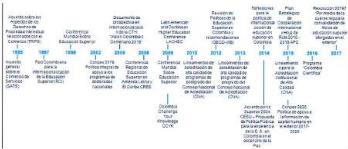
Gráfico 1 Hitos globales, regionales e internacionales en internacionalización

La publicación en 2014 del Acuerdo por lo Superior 2034 que publicó el Consejo Nacional de Educación Superior (CESU) – Propuesta de Política Pública para la excelencia de la educación superior en Colombia en el escenario de la Paz y las Reflexiones para la política de internacionalización de educación superior en Colombia; y en 2016 el lanzamiento del Programa Colombia Científica.